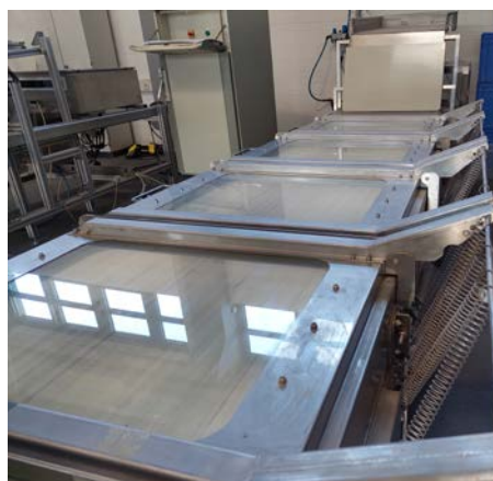
Abb.: Aufbau Transportstrecke am Demonstrator im Fraunhofer IOSB

Ein zweiter Demonstrator mit optimierter Materialführung ist nunmehr aufgebaut. Die Präsentation der Ergebnisse erfolgt im Live-Betrieb im Rahmen der OCM-2023.