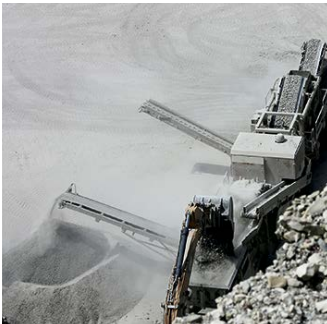
Feinmaterial als kritische Fraktion von Bauabbruch.