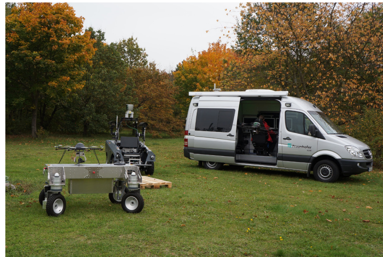
Mobile AMFIS-Kontrollstation (integriert in einen Sprinter).

Offene Schnittstellen, basierend auf Standards, sorgen dafür, dass weitere Systemtypen interoperabel und einfach integrierbar sind und die gesammelten Daten in Echtzeit (auch während der Bewegung der mobilen Systeme) an Führungs- oder Auswertesysteme geliefert werden können.