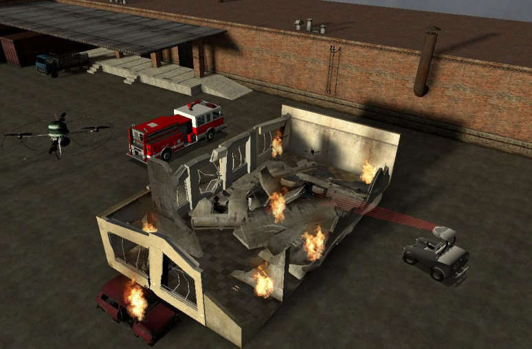
AMFIS: Simulation eines UAV-Einsatzes bei einem Brand.

Die Simulation von Szenarien mit AMFIS ist in die AMFIS-Kontrollstation so integriert, dass steuerungstechnisch kein Unterschied zwischen realen und simulierten Sensoren und Sensorträgern besteht – sie sind nahtlos austauschbar. Dies ermöglicht: